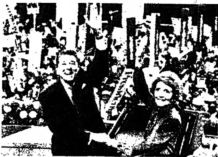
رونالد ريفان وزوجته بلوحن للجمهوريين المحتشد لتحيته بعد ان اصبح مرشح الحزب الجمهوري الاميركي لانتخابات الرئاسة الامريكية .

رويت - صرح السيد رونالد ريفان مرشح الحزب الجمهوري لانتخابات الامريكية بأنه اذا انتخب رئيساً للولايات المتحدة فانه سيساعد على حل المشاكل في الشرق الاوسط الا انه لن يخلي أي حل ولن يفرضه قرضاً . واضاف انه يعتبر اسرائيل عاملاً ذا نظام حكم مستقر وشريكاً للولايات المتحدة وان جيش الدفاع الاسرائيلي هو جيش ناجح وفعال .